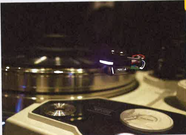
中央の光る部分が光電式カートリッジ。価格が70万円という最上位機種だ