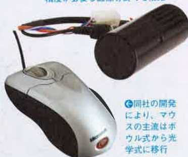
同社の開発により、マウスの主流はボウル式から光学式に移行