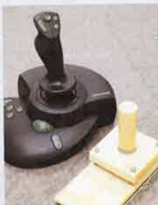
ジョイスティックの試作品。光を使うことで耐久性がUP。

共同で光学マウスの開発を行うなど、マイクロソフト社とは20年来のパートナー。同社から「比類なき技術」と表彰されるほど信頼を受けている。ほか1億円相当の顕微鏡やオートフォーカスなど、光の開発は無限大の可能性を秘めている。