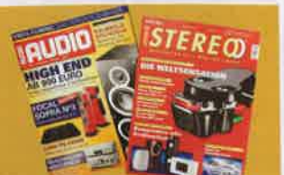
15年に思えば1位と評価。その雑誌は同社製品が誌面を飾っている

権威あるドイツ最大手雑誌2誌から、歴代最高評価を獲得し、世界中から注目を集めた。リリース後、わずか2年での快挙!